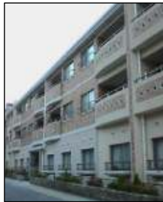
気象台側より撮影