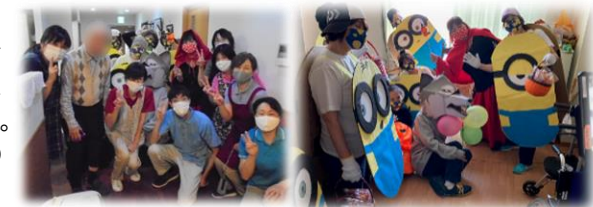
↑グループホーム ときともみなさまと

夕方からは、数名のスタッフと【武庫の里ケアハートガーデン】(グループホーム ときとも)へもお邪魔し、季節のイベントを楽しんで頂きました。