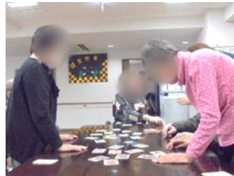
▲耳を澄まして！早い者勝ちのスピード勝負

をじっくりとよ〜く聞きながら、身乗り出すご様子は真剣そのものでした！ 実はかるたは楽しい遊びだけでなく、読み上げを聞くための集中力を養い、札を取る動きで手や身体の運動にもなる、とても良いリハビリになるんです！ 楽しみながらリハビリもできる遊びは、他にもたくさんあります。 今年はそのような遊びにどんどんチャレンジして、皆さんと一緒に、たくさんの方の楽しんでもう一度読んでみたいと思います！